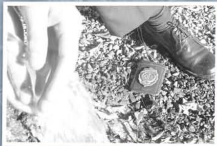
"Tenemos las manos limpias"