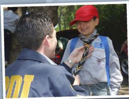
"La cercanía da alegría"