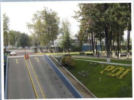
"Tú escoges el camino correcto... Nosotros te damos las herramientas"

En este contexto, el Departamento de Ética y Derechos Humanos de la Policía de Investigaciones de Chile organizó el concurso fotográfico 2009. La idea fue retratar a través de imágenes estáticas prácticas policiales en su accionar diario, de manera de plasmar la cultura ética en función de resguardar la integridad social y contribuir al respeto de los derechos y libertades en su rol de servir a la comunidad 🐾